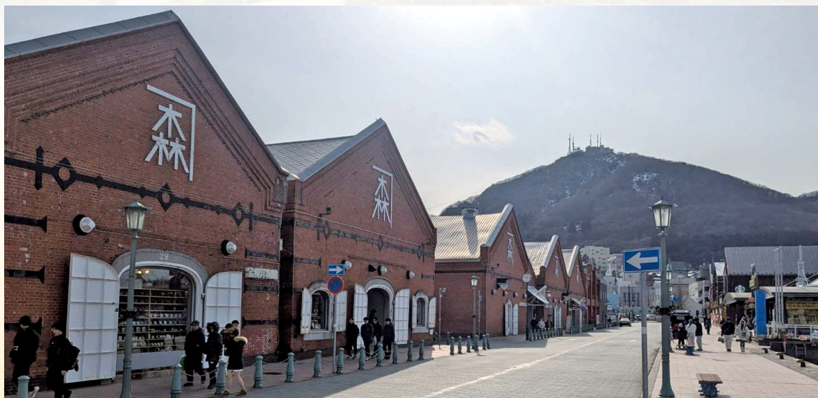
金森赤レンガ倉庫

函館市のベイエリアにある人気スポットで、港に面して赤レンガの倉庫が立ち並ぶ景色は、函館を代表する風景の一つです。金森赤レンガ倉庫の歴史は、金森倉庫の創業者、初代 わたなべくましろ 渡邊熊四郎が、最初の事業である金森洋物店を開業したところから始まります。1887（明治20）年、函館で最初の営業倉庫として開業した赤レンガ倉庫は、大火で一度は焼失したものの、その後復興をとげて、今では海運業盛んな頃の面影を色濃く残す函館ベイエリアの象徴の一つとなっています。和洋折衷の美しい文化を一度に味わうことのできる施設で、函館ならではの買い物やレストラン、様々な体験教室があり、時間の流れを忘れるぐらい魅力的なスポットとなっています。